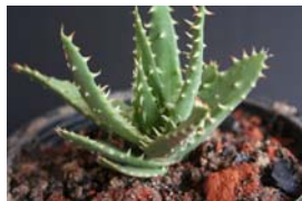
A. erinacea “ใหญ่”