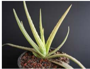
A. vera “ต่างประเทศ”