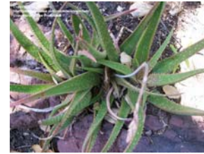
A. albiflora X A. littoralis