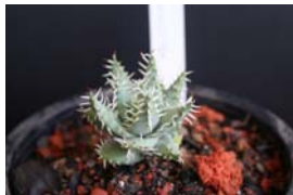
A. erinacea “แคระ”