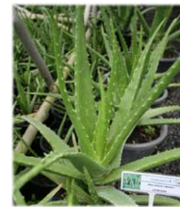
A. indica Royle